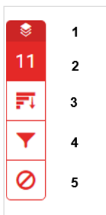
Slika 33. Alati za pregled izvora i postavke izvještaja o podudarnosti